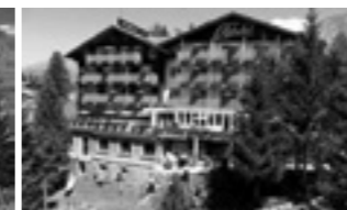
Swiss Family Hotel Alphubel