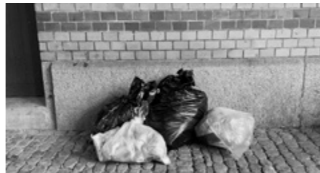
Abfall vom Monat Juni und der Litteringkampagne.