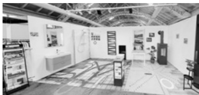
Die Besucher/innen der Gewerbeausstellung in Langenthal durften in unserem Wettbewerb die Länge aller Bodenrohre auf der Bodenfolie schätzen