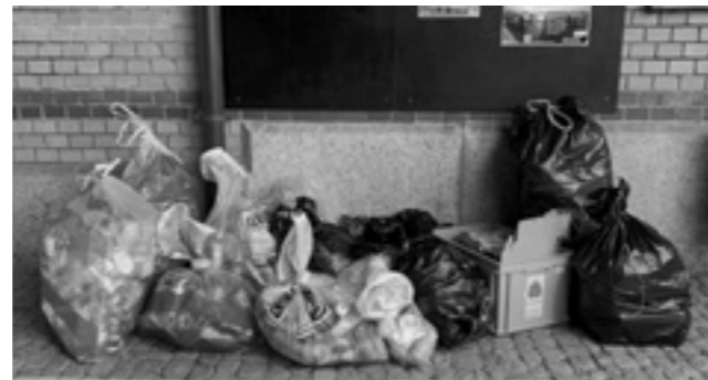
Abfall vom Monat Mai mit dem bisherigen Kioskangebot.

im Monat Juni in den Abfalleimern der Jugendtreffs Langenthal, Roggwil, Bützberg und Lotzwil gelandet ist. Der angefallene Abfall ist zurück zu führen darauf, dass die Jugendtreffs zwar keine verpackten Lebensmittel mehr abgegeben haben, aber die Besuchenden weiterhin ihre bevorzugten Lebensmittel in den Räumlichkeiten konsumieren konnten. Die Litteringkampagne und speziell die Gegenüberstellung wird in diversen Jugendtreffs weiterhin spürbar sein und das Kioskangebot, welches bis zur Kampagne zu finden war, wird mehrheitlich angepasst. Wie die Anpassung jeweils aussehen wird, ist von der zuständigen Fachperson, den Jugendteams und den weiteren Besuchenden abhängig.