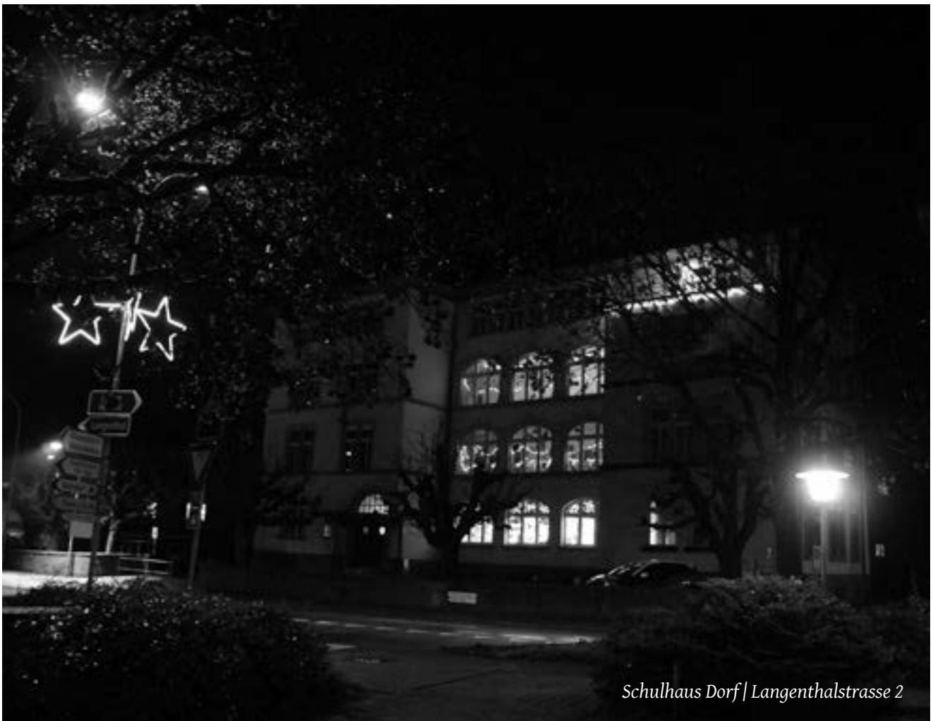
Schulhaus Dorf | Langenthalstrasse 2