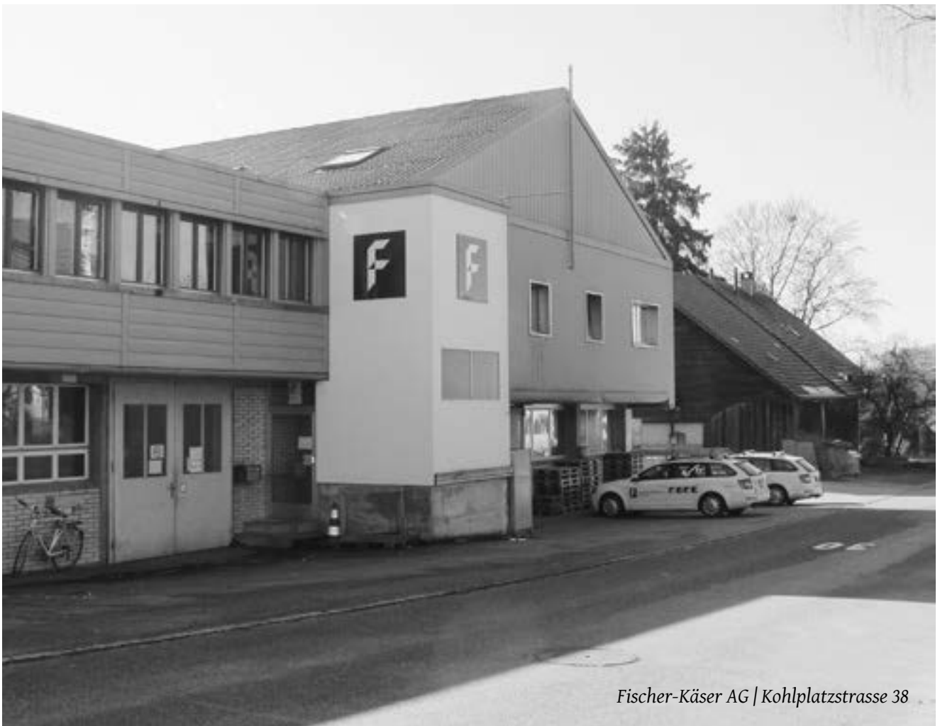
Fischer-Käser AG | Kohlplatzstrasse 38