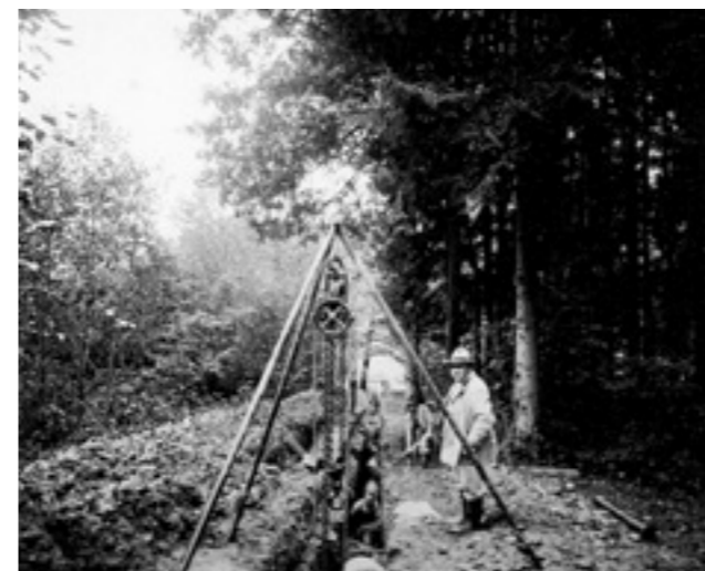
Dreibein, Kettenzug und viel Handarbeit: Im Herbst 1930 verlegen IBL-Mitarbeitende eine Gussleitung am Sandgrubenweg

In diesen Winterwochen startet die IBL ihr Jubiläumsjahr 2019 mit ersten Details zu den geplanten Aktivitäten und beleuchtet wichtige Ereignisse aus ihrer Historie. Sie spannt den Bogen von den Wurzeln des Unternehmens als Licht- und Wasserwerk über die heutige Zeit bis in die Zukunft.