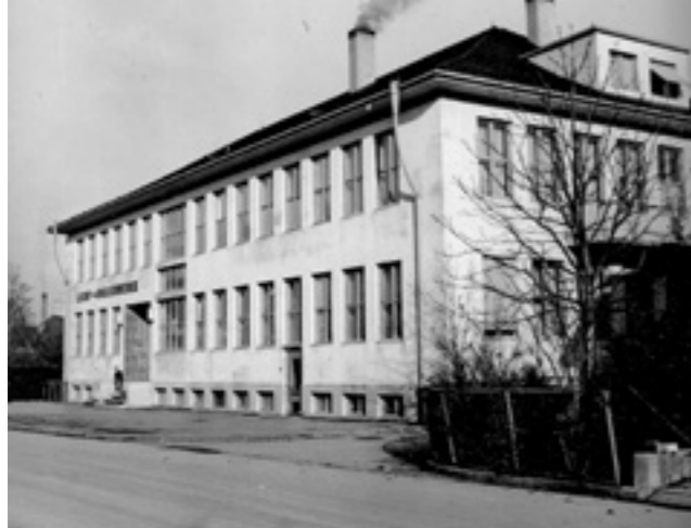
1937 erstellt und bis heute Sitz des Versorgungsunternehmens: Das Verwaltungsgebäude der IBL an der Talstrasse in Langenthal

sorgungsunternehmen im Verlaufe des Jubiläumsjahres 2019 immer wieder zeigen und nach und nach spannende und eindruckliche Einblicke in die verschiedensten Bereiche bieten. So wird sie beispielsweise über die Arbeitsschritte informieren, die die komplexe Leitungsführung und deren Installationen erfordern oder was getan werden muss, um höchste Wasserqualität garantieren zu können. Mit dem eigentlichen Jubiläumstag im September sind dann alle Interessierten eingeladen, spielerisch die IBL noch besser kennenzulernen.