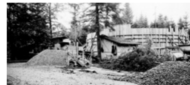
Mit dem Bau des Wasserreservoirs im Schorenwald wurde im September 1930 begonnen, Ende Oktober stand bereits die Schalung des östlichen Behälters.

Denn die IBL ist viel mehr als bloss die «Verbindung» der Menschen im Oberaargau. Dies wird das Ver-