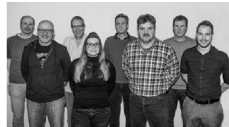
Das OK der LOGA 2019 freut sich über das grosse Interesse der Gewerbler, die mit ihrer regen Teilnahme für eine jubiläumswürdige Ausstellung sorgen.

Damit steht bereits fest, dass auf die Besucher eine attraktive und äusserst vielfältige Gewerbeausstellung warten wird. Damit begnügt sich das OK jedoch nicht, es ist zudem bestrebt, den Besuchern ein unterhaltsames und abwechslungsreiches Rahmenprogramm zu bieten, damit sich ein Besuch der LOGA zusätzlich lohnt. So wird der Trägerverein für offene Kinder und Jugendarbeit Oberaargau (ToKJO) mit einem interessanten Angebot für Kinder und Jugendliche vor Ort sein. Helikopter-Rundflüge sowie eine