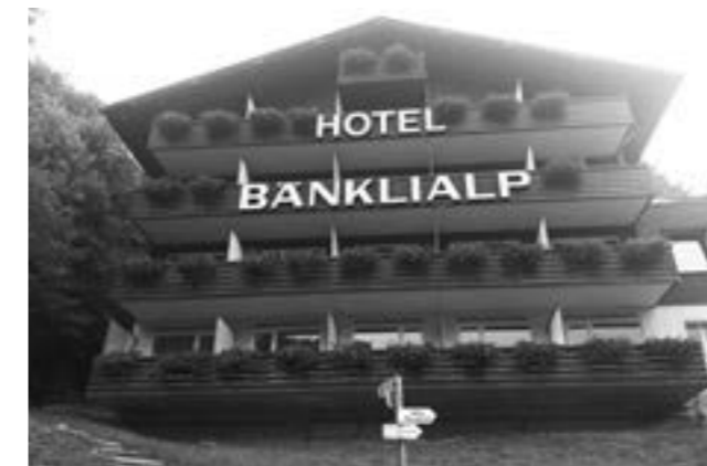
Hotel Bänklialp, Engelberg