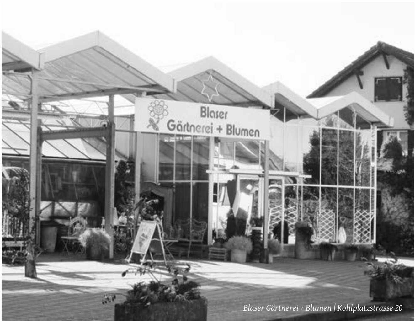
Blaser Gärtnerei + Blumen | Kohlplatzstrasse 20