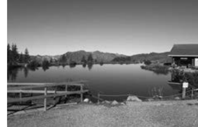
27.09.2018 Engelberg/Brunni, Härzlisee 1'680 m