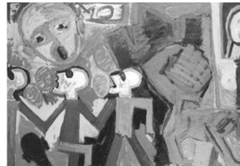
«Mo» Öl auf Baumwolle | 2000 x 3000 mm