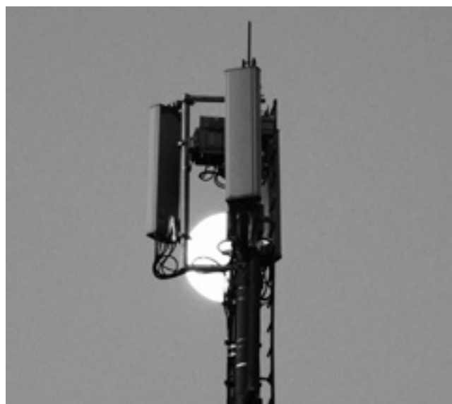
Vollmond hinter der Silospitze beim Bahnhof Lotzwil