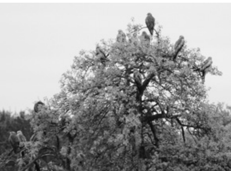
Ein Baum in Lotzwil voller Rotmilane