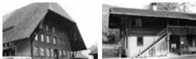
In solchen Häusern können Fledermauskolonien vorkommen. Fledermäuse sind meist sehr heimlich und werden oft auch übersehen.

Dazu suchen wir Hausbesitzer, die Fledermäuse beherbergen oder bei denen ein starker Verdacht