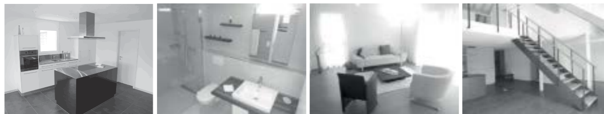
hell.. modern.. grosszügig.. individuell..

Rufen Sie uns an. Wir informieren Sie gerne über unsere aktuellen Angebote!