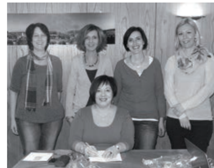
Das komplette Lotzbu Löi-Team.

Wie Sie sicher bereits schon bemerkt haben, wird der Löi seit der letzten Ausgabe nicht mehr mit der Werbung, sondern mit dem Anzeiger verteilt. Damit wird nun sichergestellt, dass der Löi stets pünktlich in Ihrem Briefkasten liegt.